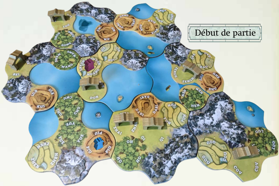
Début de partie