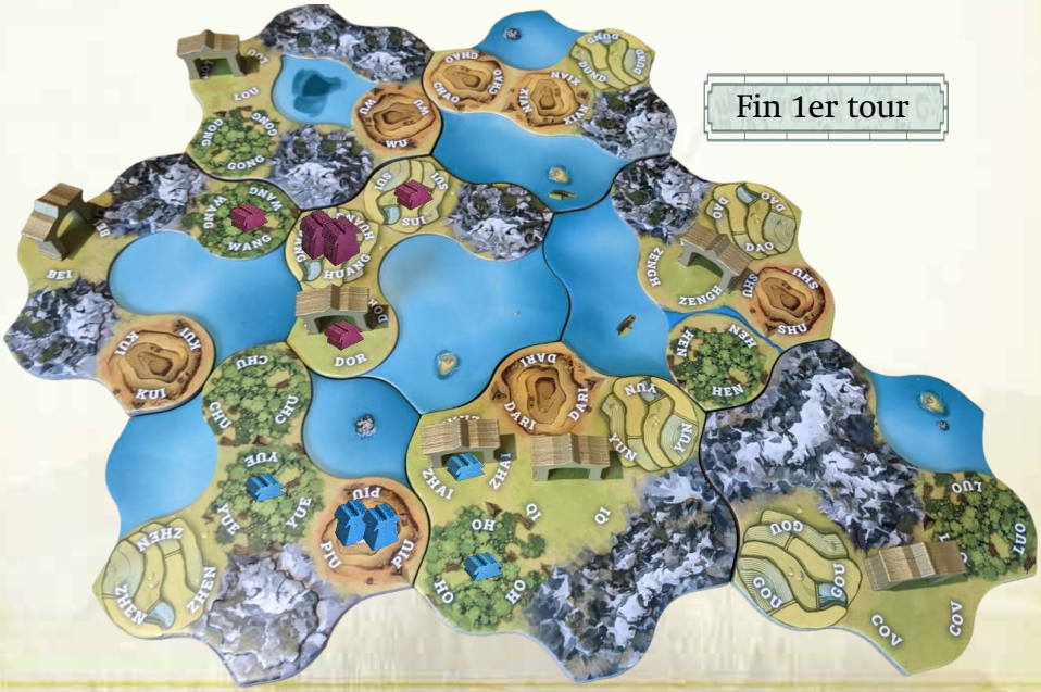
Fin 1er tour